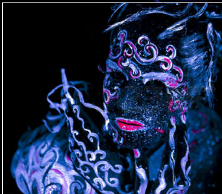
UV bodypainting v podání umělce Alienjedna