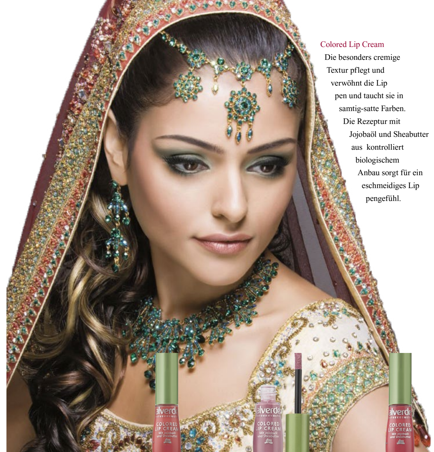
30 - Deep Coral

Die besonders cremige Textur pflegt und verwöhnt die Lippen und taucht sie in samtig-satte Farben. Die Rezeptur mit Jojobaöl und Sheabutter aus kontrolliert biologischem Anbau sorgt für ein geschmeidiges Lippengefühl.