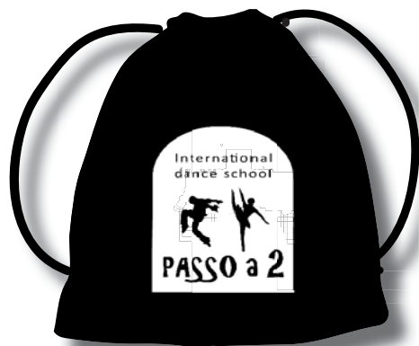
◀ SACCHETTO PORTASCARPE

MAGLIETTA UNISEX: FRONTE A SINISTRA, RETRO A DESTRA