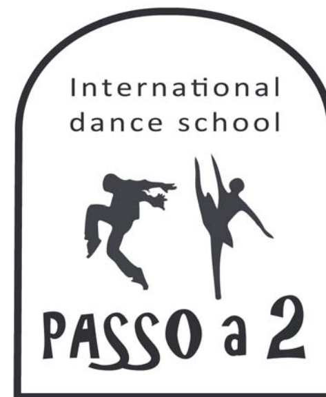
SCALA DI GRIGI RGB 51 51 51 CMYK 72 64 60 58