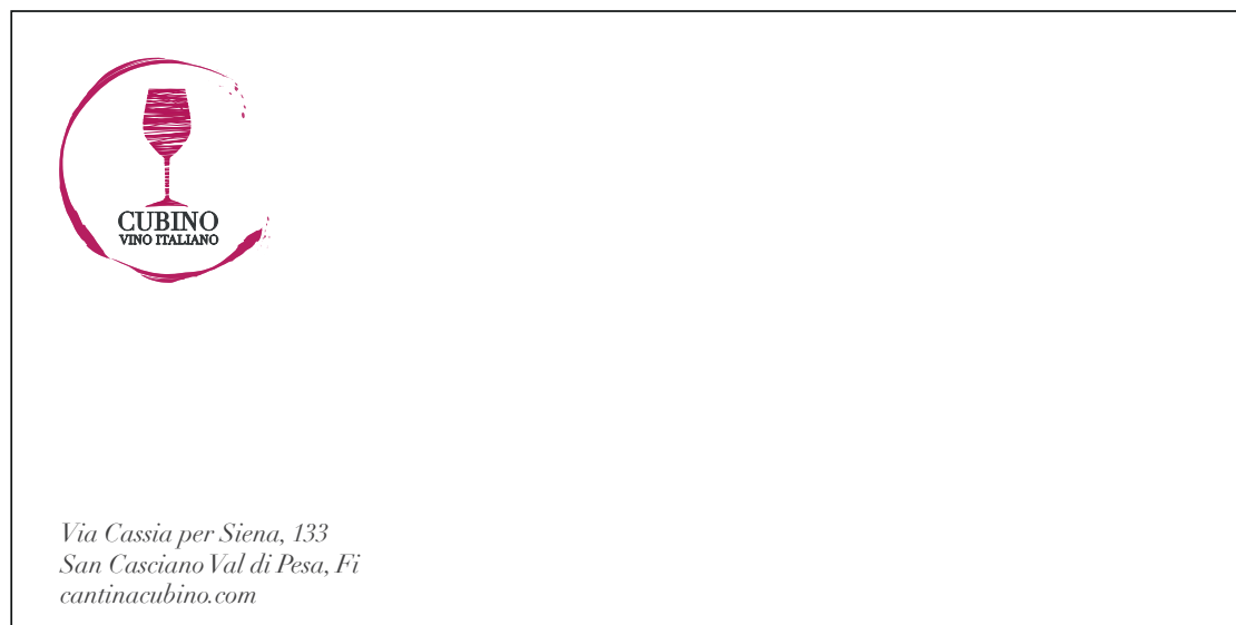
Busta da lettera