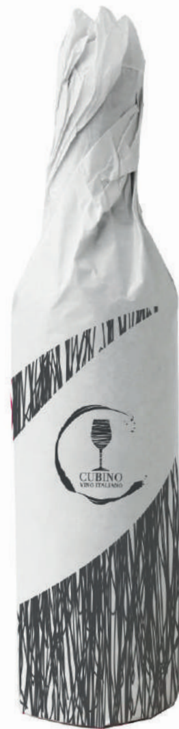
Shopper e carta regalo