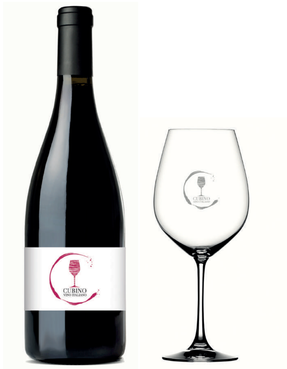
Bottiglia con calice