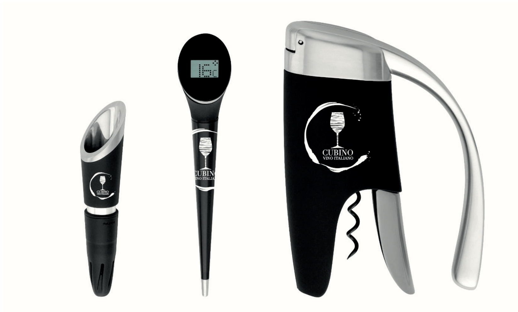
Tappo, termometro e cavatappi