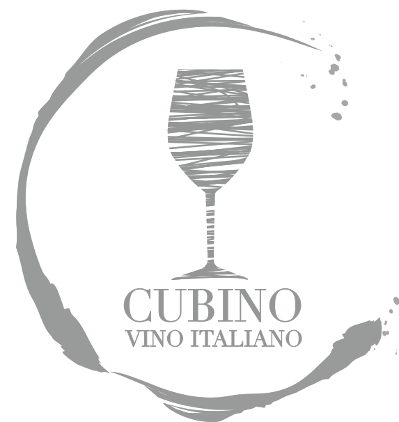
Positivo/negativo/scala di grigio