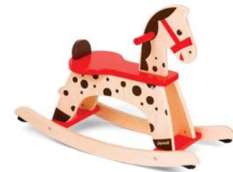
Cavallo a dondolo dimensioni 79 x 31 x 57 cm