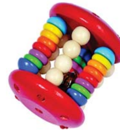
Sonaghetto a gabbietta dimensione 6 cm