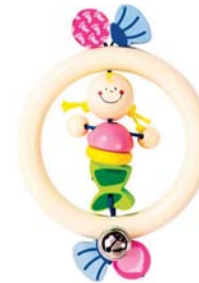
Sonaglio sirena dimensioni 14 cm