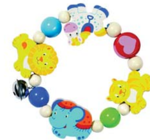
Sonaglio circo dimensioni 11 cm